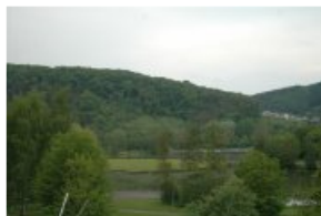
Pelouse calcaire Echternacht