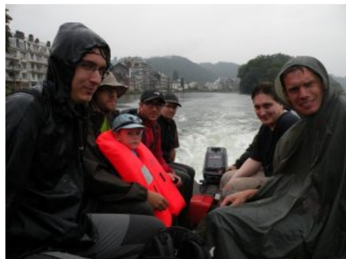
Sortie en bateau à la fin