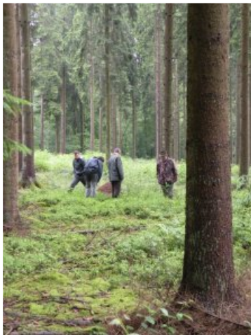
Sortie à Beauraing

Il nous fallait absolument effectuer cette sortie préparatoire dès cette année pour nous rendre compte de toute l'organisation à mettre en œuvre afin d'optimiser notre temps lors des sorties ultérieures prévues en 2014 (sous le soleil !!!).