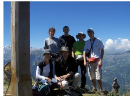
Vue sur la pelouse calcaire derrière le lac d'Echternach