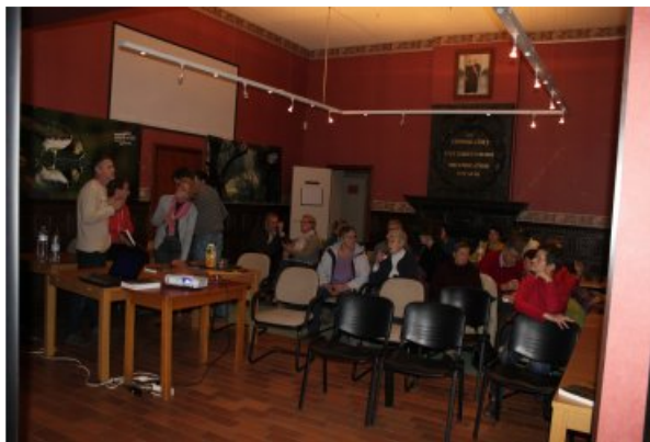
Conférence à Ohey

Le groupe Fourmiswalbru a été contacté pour donner une conférence sur le thème des fourmis à Ohey (Région Namuroise). Cette soirée était organisée par le pcdn de Ohey et s'est déroulée le vendredi 8 novembre. Une bonne vingtaine de personnes était présente à cette présentation. Tous les participants semblent avoir apprécié l'exposé et, d'après Maximilien, plusieurs d'entre eux se sont laissés emporter par la passion de l'orateur. A la demande de plusieurs personnes, nous organiserons probablement une sortie de groupe dans cette région en 2014.