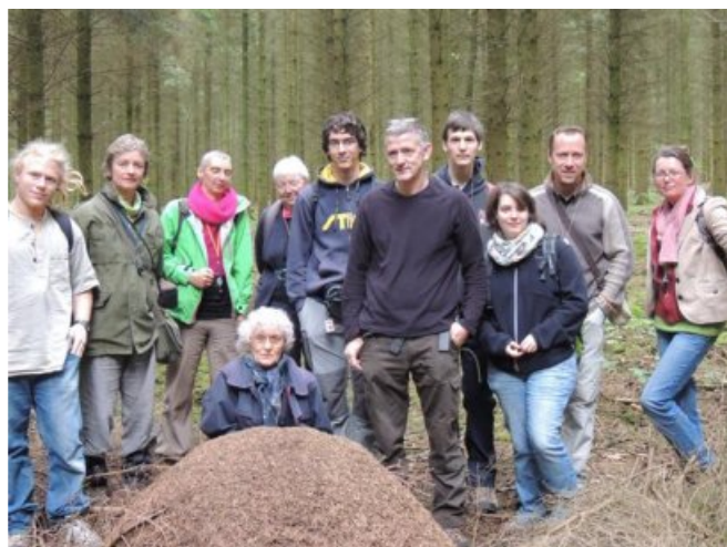
Stage fourmis à Vierves sur Viroin

Cette petite sortie de deux heures nous a permis de dénicher : L. flavus , L. platythorax , T. erraticum , F. rufa , F. cunicularia , F. fusca , T. unifasciatus , T. interruptus , T. albipennis , T. nylanderi , S. fugax , P. coarctata , A. subterranea , M. sabuleti , M. schencki , et M. scabrinodis , soit 16 espèces.