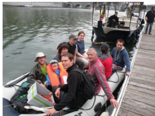
Sortie en bateau au début