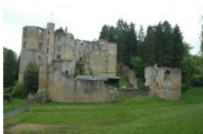
Château à Beaufor

Il nous reste encore beaucoup de travail à réaliser pour statuer sur certaines espèces. La rédaction d'une note sur cet inventaire est également prévue en 2014.