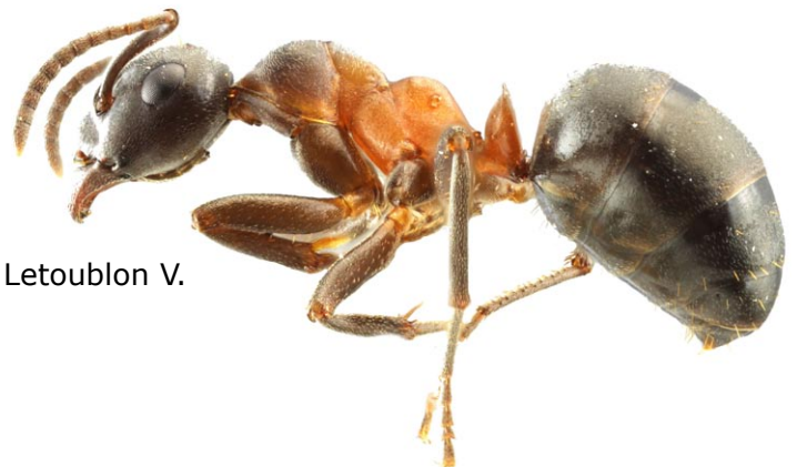
Formica uralensis

Formica uralensis - Doubs (25) Wegnez P. et al. Formica bruni - Doubs (25) Walbru et Letoublon V. Lasius rabaudi - Pyrénées-Orientales (66) Lebas C.