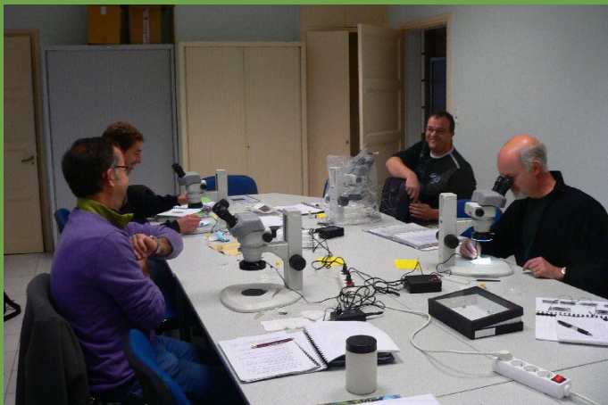
Formation ONF à Quillan (11) 25-27 octobre 2011

Baucoup d'autres sorties, organisées ou improvisées, entre les différents récolteurs ont contribué à créer une émulation à maintenir cette année pour encore davantage de territoires échantillonnés!