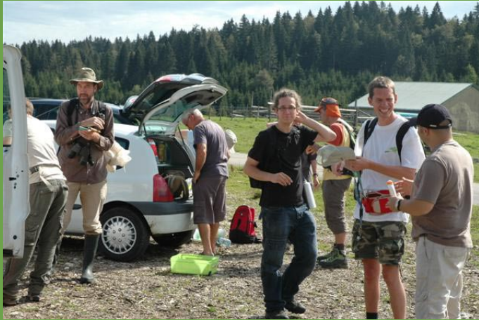
Rassemblement Walbru-Antarea Jura (39) 18-24 août 2011